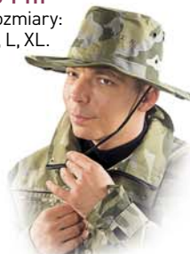
UJ-FTH Rozmiary: M, L, XL.