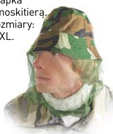
UJ-HL01 Czapka z moskitiera. Rozmiary: L, XL.