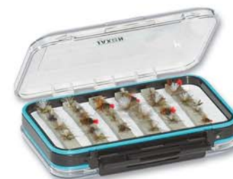
RJ-HB...A WERSJA Z NACIĘCIAMI