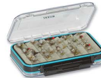
RJ-HB...B WERSJA FALA