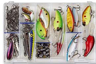
PUDEŁKO W WERSJI ZERUST

RF-6004R PUDEŁKO TUFF TAINER Do akcesoriów i przynęt spinningowych. Wymiary: 406/225/38 mm.