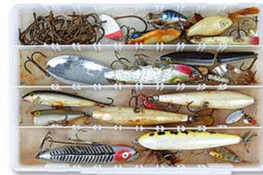
ZARZEWIAŁE PRZYNETY W PUDEŁKU BEZ OCHRONY ZERUST